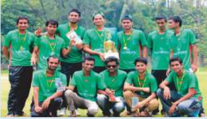
রুয়েটে সিভিল প্রিমিয়ার লীগে চ্যাম্পিয়ন দলের সদস্যরা।

Civilian ৯ উইকেটে Civil Warriors কে পরাজিত করে ফাইনালে পৌছায়। অপর সেমিফাইনালে Vivacious Gladiators কে ৭ রানে পরাজিত করে Keltu Warriors। ১২ মে ২০১৬ জমকালো ফাইনাল ম্যাচে The Royal Civilian কে ৫ উইকেটে পরাজিত করে শিরোপা নিজেদের দখলে নেয় Keltu Warriors।